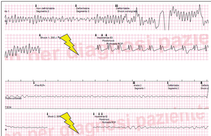
Figura 1.2 - Due esempi di FV, una larga ( in alto ) con alto successo di risposta alla defibrillazione e una fine ( in basso ) con scarso successo di risposta alla defibrillazione.

co prima della fibrillazione; e la fase metabolica (oltre i 10 min di arresto), caratterizzata da marcato accumulo di metaboliti ischemici e con poca probabilità di successo delle manovre rianimatorie (Figura 1.2).