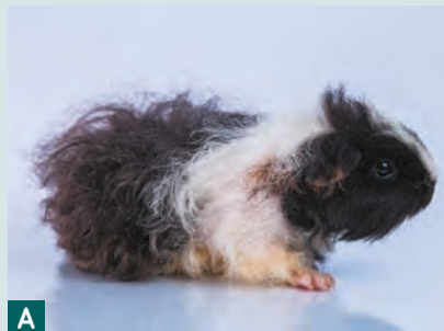
(A) Alpaca adulta. (B) Cucciolo di Alpaca