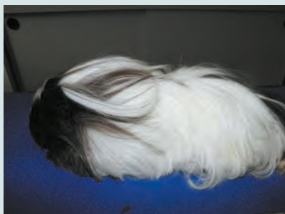
Silkie (o Sheltie)