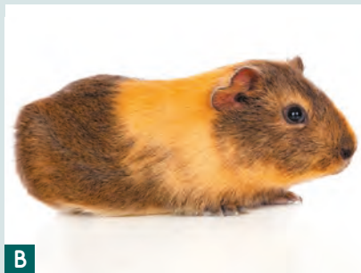
Mantello bicolore. (A) Bianco e rosso. (B) Crema e aguti crema