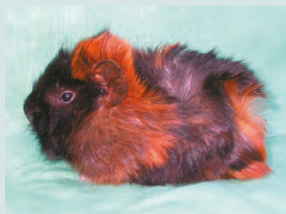
Cavia di razza abissina con mantello brindle (mescolanza di peli neri e rossi)