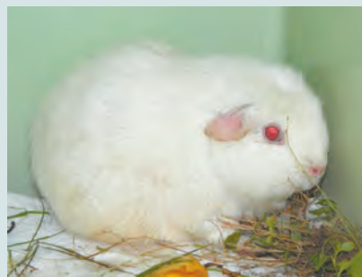
Bianco occhi rossi