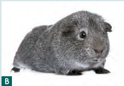
(A) Aguti crema. (B) Aguti argentata