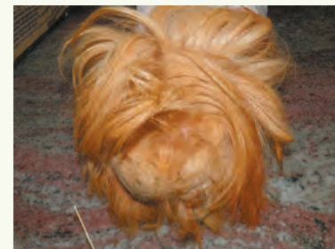
FIG. 1.2 Infeltrimento del pelo della regione coccigea in una cavia a pelo lungo.

Per quanto spettacolari, le cavie a pelo lungo sono difficili da gestire e richiedono la spazzolatura quotidiana del mantello e la rasatura periodica della zona sopracaudale. Sono sconsigliate come pet, a cui sono da preferire le razze a pelo corto ( Fig. 1.2 ).