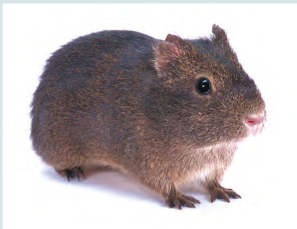
FIG. 1.1 Cavia tschudii è la probabile progenitrice della cavia domestica.

esempio i rifugi scavati da altri animali). È un erbivoro obbligato e trascorre una considerevole quantità di tempo mangiando.