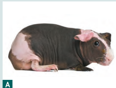
Skinny, adulto (A) e neonato (B).