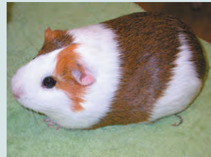
Mantello tricolore, bianco, aguti e crema