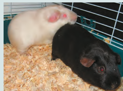
Due caviae con la mutazione satin, che conferisce al pelo una particolare lucentezza ma può comportare gravi difetti congeniti