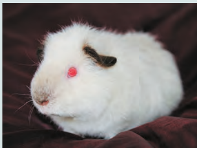
Cavia di razza Teddy con mantello himalaiano