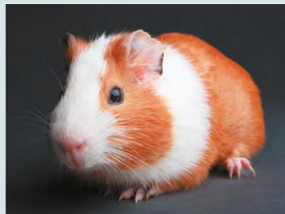
Olandese. La parte colorata può avere numerose colorazioni