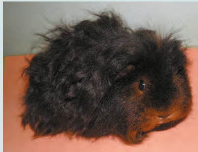
Cavia di razza Texel con colorazione tan