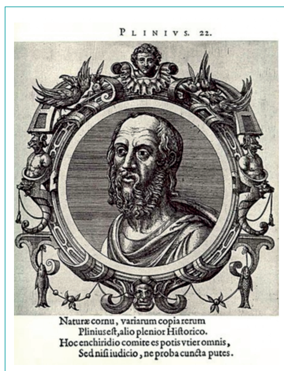
Fig. 2.2 ⇨ Plinio il Vecchio.