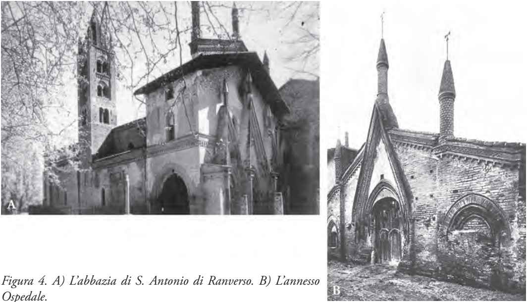
Figura 4. A) L'abbazia di S. Antonio di Ranverso. B) L'annesso Ospedale.

questo termine si estende a tutta la regione padana. Carlo d'Angiò usò per la prima volta il termine « Contea di Piemonte » per definire i suoi domini subalpini compresi fra Cuneo, Cherasco, Bra, Savigliano e Alba. Ma lo stesso nome veniva usato dai Conti di Savoia sin dal 1200 per delineare i loro territori lungo la valle della Dora. Amedeo VIII unisce i vecchi domini angioini e quelli sabaudi e crea il « Principato di Piemonte » (Fig. 1); il termine si estende progressivamente con l'estendersi dei territori sabaudi sino a raggiungere nella prima metà del Settecento un'area pressoché simile a quella dell'attuale regione; ed è in questo periodo che i Savoia adottano il titolo di « Re di Piemonte » fondendo i due titoli di Principe di Piemonte e Re di Sardegna.