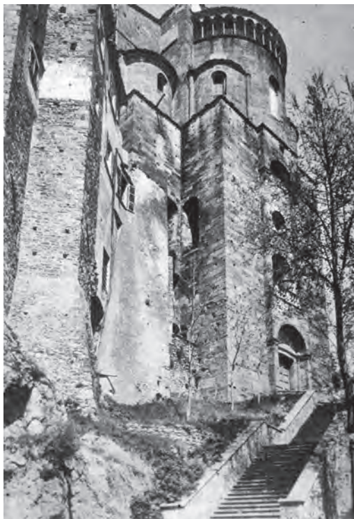
Figura 2. La Sacra di S. Michele.