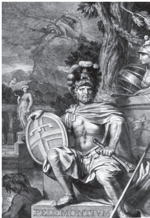
Figura 1. Allegoria del Principato del Piemonte.