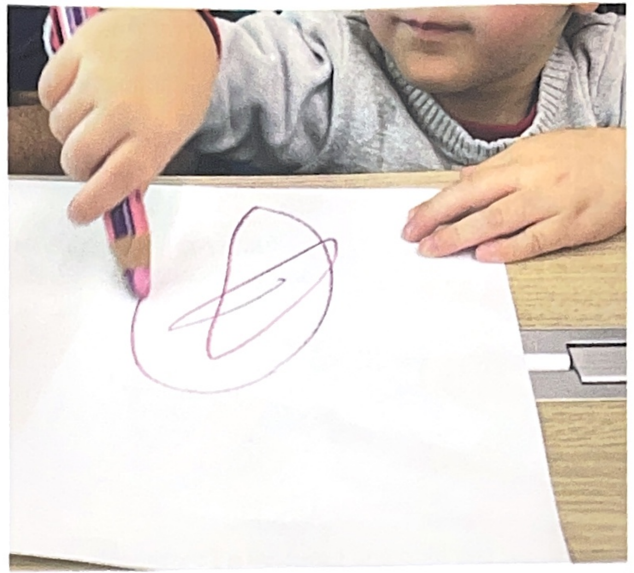
Pres a digitale pronata