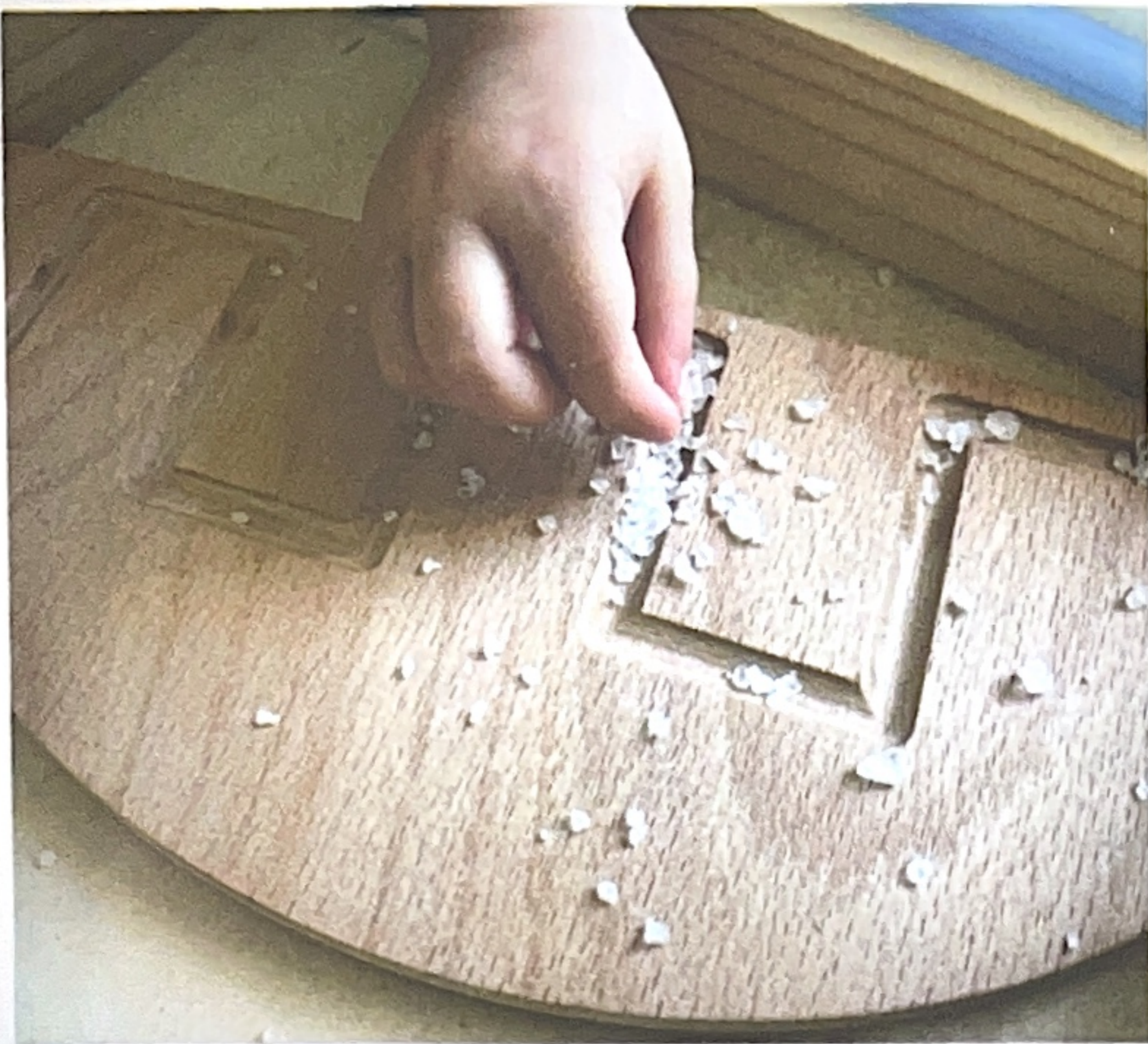
Pres a pinza