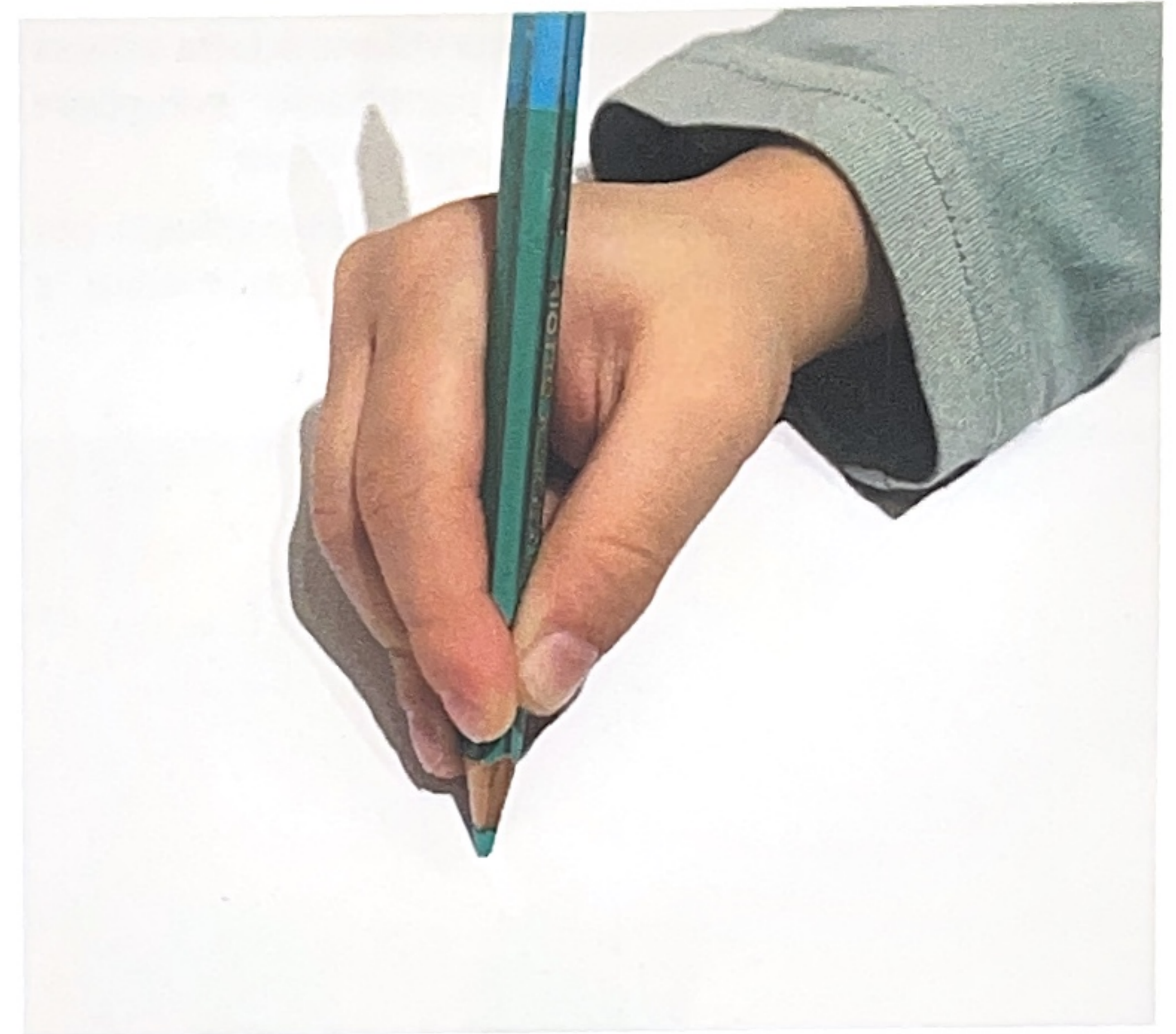
Pres a Tripode

Risulta evidente quindi che le finestre evolutive sono molto ampie e che ogni bambino avr i suoi tempi. Ci significa che  bene fare esercizi per una corretta impugnatura, ma  anche giusto rispettare la fisiologia della loro presa, a patto che non ci sia - per esempio - una presa disfunzionale dello strumento grafico. Tuttavia, se un bambino a 4 anni impugna