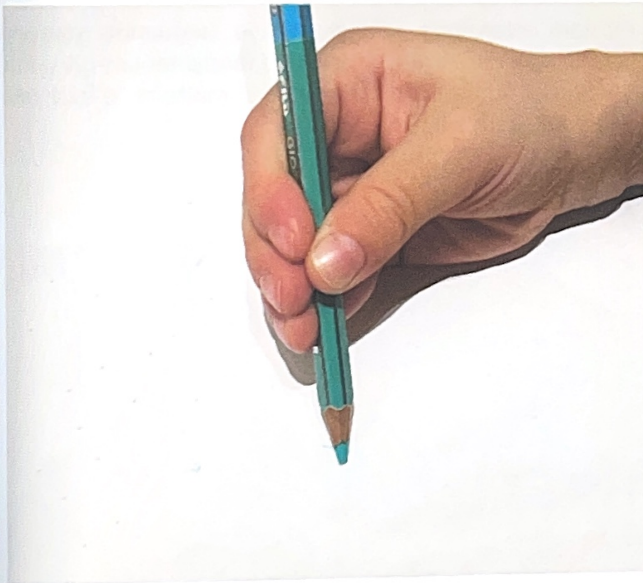
Pres a Quadripode